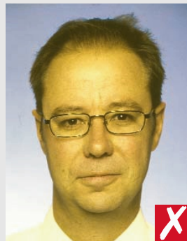
tom de pele não natural