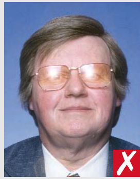
reflexo de flash nas lentes