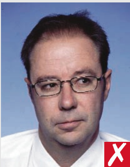
olhando p/ o lado