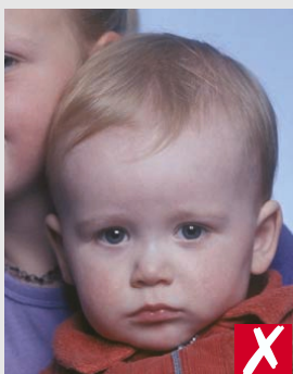
mostrando outra pessoa