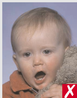
boca aberta e brinquedo próximo à face