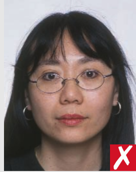
armações cobrindo os olhos