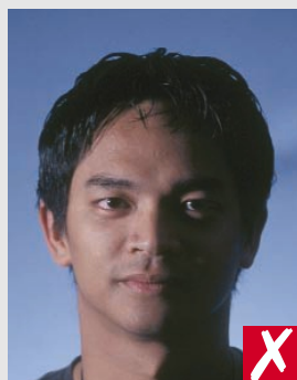
sombras na face