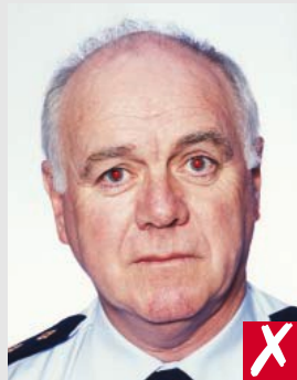
ou olhos vermelhos