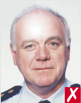
reflexo de flash