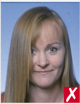
cabelo cobrindo os olhos