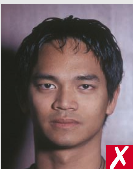
sombras atrás da cabeça