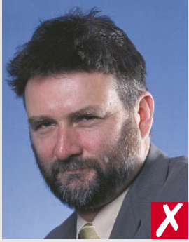
estilo porta retrato